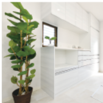
クリナップ「ステディア」の背面には、作業しやすいカウンターと大容量の収納を設置。

実家の近くに中古戸建をリフォームしたE様は、「小さな子どもがいるので、使い勝手のいいLDKにしたい」と、長身の奥様がラクなカウンター高90cmのオープンキッチンを対面にして、子どもの様子がわかる安心感もバッチリです。