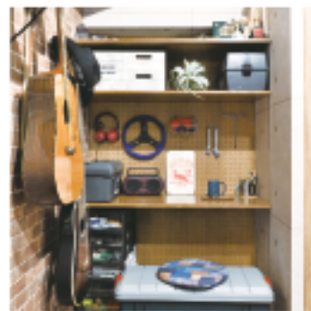
クローゼット横をワークスペースとして有効活用。有孔ボードと棚板を使って、収納と作業台を造作

「60・70年代のアメリカンが好きで」と広げてくれた雑誌をヒントに、コンクリートやレンガ風のクロスを選んで、ヴィンテージ感を演出。さらにワークスペースを造作して、物置部屋が男心をくすぐる趣味の部屋へと、見事に生まれ変わりました。