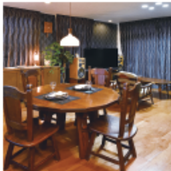
奥様が大切にされているアンティーク家具が、モダンクラシック感漂うインテリアに見事にマッチ