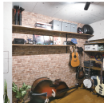
ギターやバイクが趣味のご主人。黒のインテリアダクトに照明はスポットライトでガレージっぽく