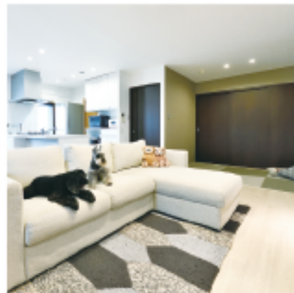
真っ白の床はお掃除カンタンで傷つきにくいフロアタイル。ご家族も愛犬もストレスを感じないリビングに