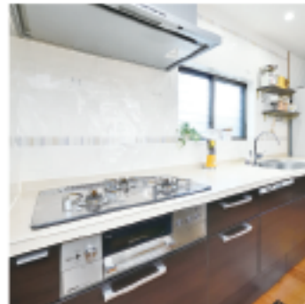
全面リフォームでキッチンも刷新。ダークカラーのリクシル「リシェル」に、英国製タイルを