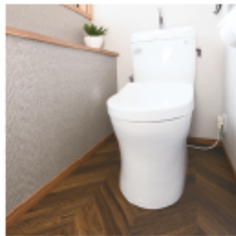
2Fのトイレはご主人専用、ヘリンボーン柄フロアタイルで、男性好みのモダンテイストに